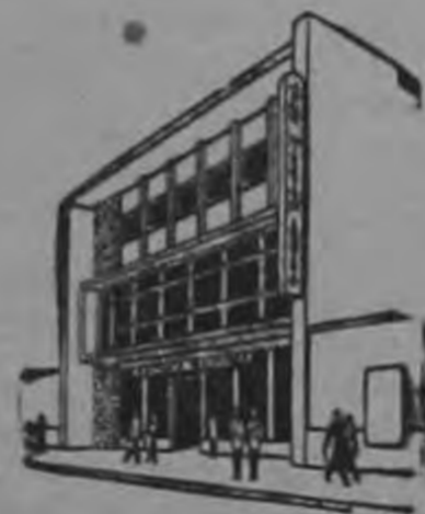
Fundado en 1...

Hay un modelo para Usted! Verdadera ganga en precio y condiciones