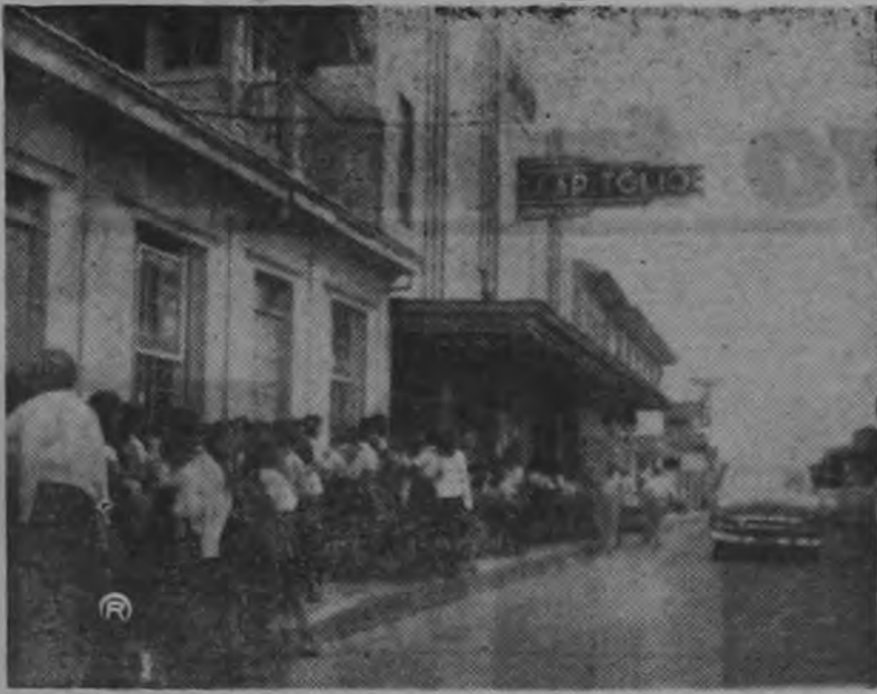
Ayer —y posiblemente en atención a sugerencia que hicieramos en su oportunidad— se proyectó, para alumnos de escuela primaria, a los que se ve formando "cola" en el cine Capitolio, la formidable cinta anti comunista RAPSODIA DE SANGRE. Ojalá todos los estudiantes de Costa Rica puedan ver esa película, que crudamente, realmente, les mostrará lo que es el comunismo en acción.